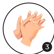
3 Doigts entrelacés Désinfection des espaces interdigitaux et des doigts