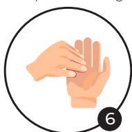
6 Ongles Désinfection des ongles