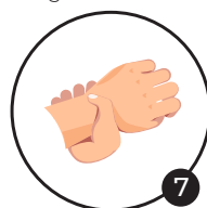
7 Poignets Désinfection des poignets