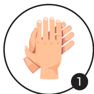
1 Paume sur paume Désinfection des paumes

Sur les mains : pour une action virucide : pulvériser IDOS MEDISPRAY sur les mains, et les frictionner pendant 30 à 60 secondes (selon l'activité souhaitée) sur l'ensemble de l'épiderme, selon les indications ci-dessous. Laisser sécher // Pour action bactéricide par friction : pulvériser 3 ml d' IDOS MEDISPRAY sur les mains et les frictionner pendant 30 secondes sur l'ensemble de l'épiderme, selon les indications ci-dessous., puis renouveler cette pulvérisation / friction une seconde fois. Laisser sécher.