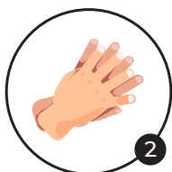
2 Paume sur dos Désinfection des doigts et des espaces interdigitaux