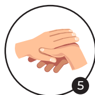
5 Pouces Désinfection des pouces