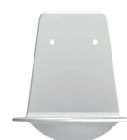
Coupelle stop gouttes (AC0170)