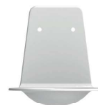
Coupelle stop gouttes (AC0170)