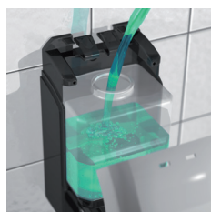
RÉDUCTEUR DE DÉBIT